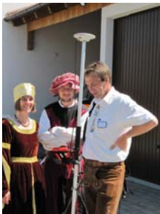
Mittelalter trifft Moderne

Unsere Besucher erwartete eine "Mangoldinger" Zeitreihe – 5 Jahrhunderte im Spiegel der Karten und Luftbilder, Liquidationspläne und –protokolle aus der ersten Hälfte des 19. Jahrhunderts, ein lustiges Entfernungsschätzen mit interessanten Gewinnen, Vorführungen moderner Messinstrumente, die Digitale Flurkarte, BayernViewer und TopMaps am PC und natürlich kompetente Beratungen rund um die amtliche Grundstücksgrenze.