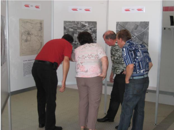
Zeitreihe mit historischen Karten und Luftbildern